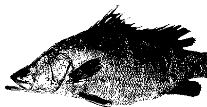
Lates niloticus , Palombo africano

stato per alcuni anni messo a nuotare (lui pesce di acqua dolce re incontrastato del Lago Vittoria) in acque marine sotto le mentite spoglie di un non meglio identificato "Palombo" africano.