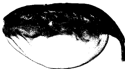
Spherooides cutaneus , Pesce palla