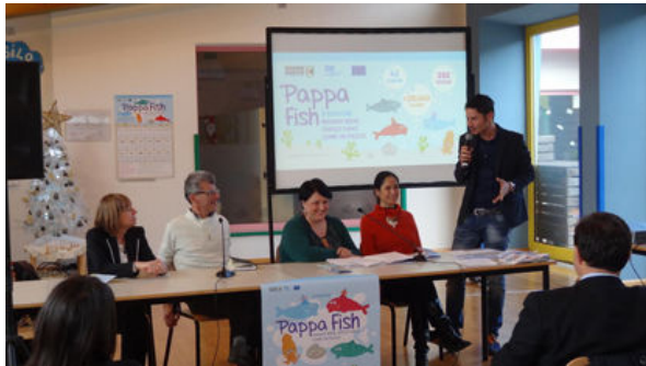
SECONDA EDIZIONE DI PAPPA FISH

Ancona | Al via la seconda edizione di "PAPPA FISH": il pesce fresco a "MIGLIA ZERO" nelle scuole di 42 Comuni.