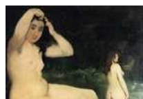
Manet per fare grande Rimini