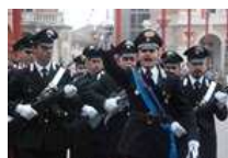
La Romagna celebra il 4 novembre