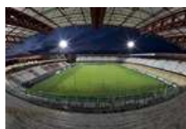
Le pagelle del Cesena le fai tu