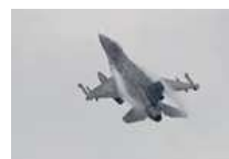
L'aeronautica militare in Romagna