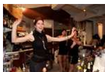
Bollicine e fuochi di Romagna