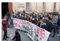
Bandiere, striscioni e studenti