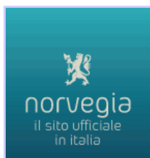
- Sito Ufficiale della Reale