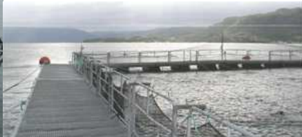
vasche in cui si allevano i salmoni, delimitate da reti che consentono il flusso dell'acqua di mare, larghe da sessanta a cento metri di diametro, profonde sino a quaranta metri.