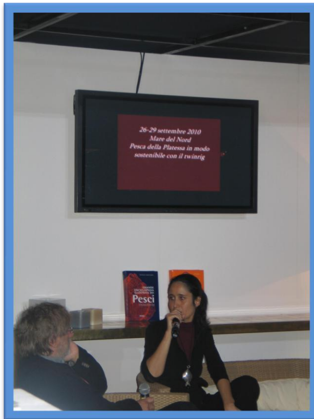
Un momento della proiezione del filmato sulla platessa pescata in modo sostenibile in Olanda e promossa dal Dutch Fish Marketing Board